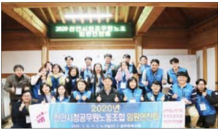
제5대 천안시청공무원노동조합 임원 연찬회 개최 천안시청공무원노동조합(위원장근수)은 3일부터 4일까지 이틀간 공주한옥마을에서 제5대 공무원노동조합 임원 연찬회를 진행했다고 밝혔다.