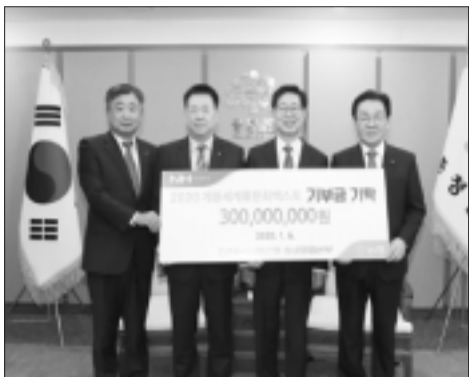
2020년 세계군문화엑스포 개막이 250여일 앞으로 다가온 가운데, NH농협은행이 군문화엑스포 성공 개최를 위해 힘을 보태기로 했다.

군문화엑스포 조직위원회 공동위원장인 양승조 충남도지사는 6일 도청 도지사 접견실에서 조두식 NH농협은행 충남본부장으로 부터 3억 원의 후원금을 기탁 받았다. 이날 기탁식에는 최홍묵 계룡시장, 도와 군문화엑스포 조직위, NH농협은행 관계자 등 10여 명이 참여했다. 군문화엑스포 조직위는 이번 후원금을 행사운영의 전시홍보 시설 설치와 프로그램 운영비 등으로 사용할 방침이다. NH농협은행은 후원금 기탁 외에도 자신들이 보유한 전국 네트워크를 활용, 전 국민들에게 군문화엑스포를 알려 나아가는 한편, 입장권 공식 지정 판매처로 협력하는 등 엑스포 행사에 큰 힘을 보탬 예정이다.