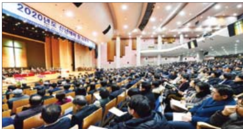
백석학원, 2020년 신년예배 및 시무식 개최