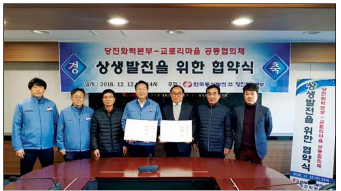
당진화력-교리마을 공동협업체 사회적 가치 실현 모습