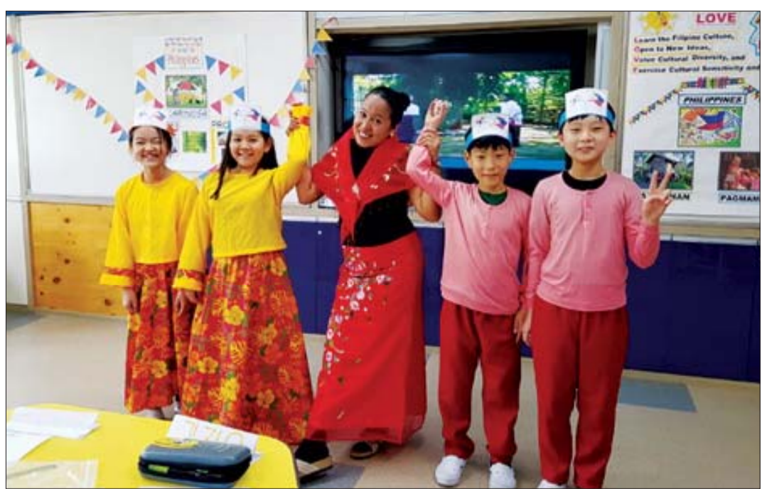
2018 다문화교육 우수사례 공모전