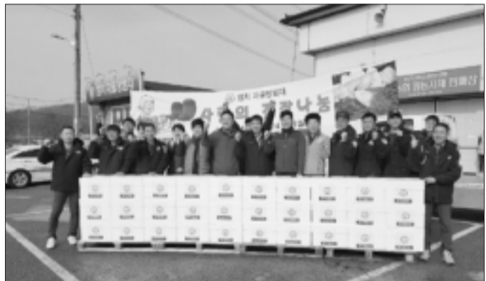
염치읍 자율방범대, 김장김치 지원