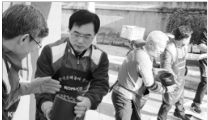
조폐공사, 연말 앞두고 '사랑의 연탄' 전달