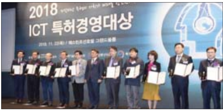
대덕대 '2018 ICT특허경영대상 특허청장 표창' 수상 대덕대는 창의적·실무형 지식재산 전문인력양성에 기여한 그간의 공로를 인정받아 '2018년 ICT특허경영대상 특허청장 표창'을 수상했다고 26일 밝혔다.