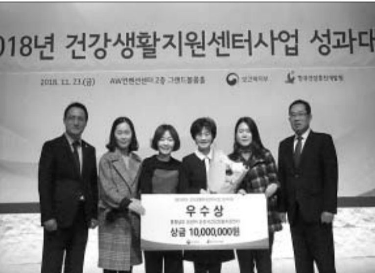
논산시(시장 황명선)가 지난 23일 서울 AW컨벤션센터에서 실시

한 2018 건강생활지원센터사업 성과대회에서 우수기관으로 선정돼 보건복지부 장관 기관표창과 인센티브 일천만원을 받았다. 논산시건강생활지원센터는 지난 해 최우수상에 이어 올해도 우수상을 수상하며 전국 50개소 건강생활지원센터 중 뛰어난 운영 능력을 인정받아 2년 연속 우수기관으로 선정돼 타 지역센터에도 귀감이 되고 있다. 성과평가는 전국 건강생활지원센터 50개소 대상 5개영역(인프라, 지역사회 현황과약, 사업운영 및 홍보, 주민 참여, 지역자원 협력)에 대해 실시하며, 시는 모든 영역에서 우수한 성적을 거뒀다. 특히, 주민 주도 '건강지킴이 협의체 및 실무네트워크'를 결성,