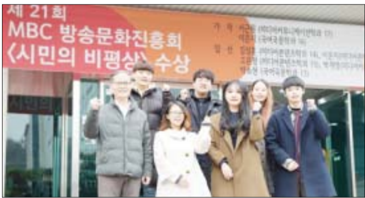
순천향대 '좋은 방송을 위한 시민의 비평상' 대거 선정 순천향대(총장 서교일)가 2018 방송문화진흥회 주최 '제21회 좋은 방송을 위한 시민의 비평상'에서 7명의 당선자를 내며, 지난해에 이어 2년 연속 방송비평분야 명문으로 두각을 나타내고 있어 눈길을 끈다.