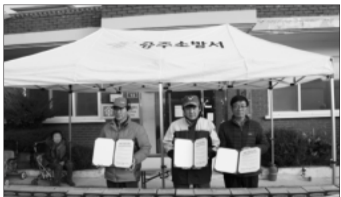
탄천면전담의용소방대, 송학리 1사촌 안전나눔 행사