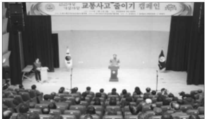
보령시, 바르게살기운동충청남도협의회와 교통사고 줄이기 캠페인