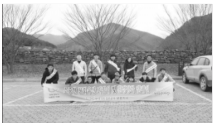
국토정보공사 대전충남본부 보령지사, 사회공헌 문화재 지킴이 활동