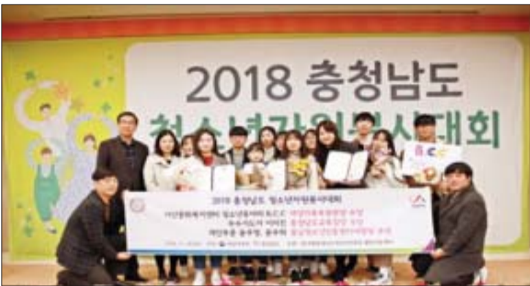
청소년영상제작동아리 B.C.C 청소년동아리 부문

포럼 참석은 아산문화재단 (afac.or.kr)에서 신청가능하며, 기타 자세한 사항은 전화 041-534-2634를 통해 문의하면 된다. 이노신=리량주기자