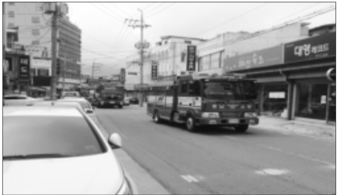
태안소방서, 소방차 길 터주기 훈련 태안소방서(서장 구동철)는 23일 오후 2시 태안읍시장 일원에서 소방공무원 및 태안군청·서산경찰서·의용소방대 등 유관기관 50여명이 참여한 가운데, 소방차 길 터주기 물시출훈련을 실시했다.