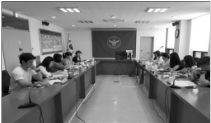
아산농, 가정폭력·이동학대 솔루션 사례회의 개최 아산경찰서(서장 김황규)는 지난 23일, 아산경찰서 사회의실에서 136센터, 보건소정신건강증진팀, 건강가정다문화지원센터 등 가정폭력 전문위원들과 함께 가정폭력으로 인한 피해자에 대한 보호조치와 사례개입방법, 의료적 치료지원 등을 위한 사례회의를 개최했다.