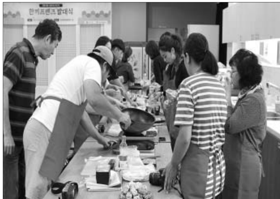
aT, 전통식품 서포터즈 '한끼프렌즈' 1기 발대식 열려 지난 23일 오후 서울 강남구 역삼동에 있는 한국전통식품문화관 이음에서 열린 한국농수산식품유통공사(aT)의 전통식품 서포터즈 '한끼프렌즈' 1기 발대식에서 참가자들이 옛감정 만들기 체험을 하고 있다.